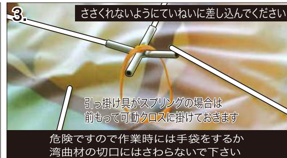
3. ささくれないようにていねいに差し込んでください 引っ掛け具がスプリングの場合は 前もって可動クロスに掛けておきます 危険ですので作業時には手袋をするか 湾曲材の切口にはさわらないで下さい