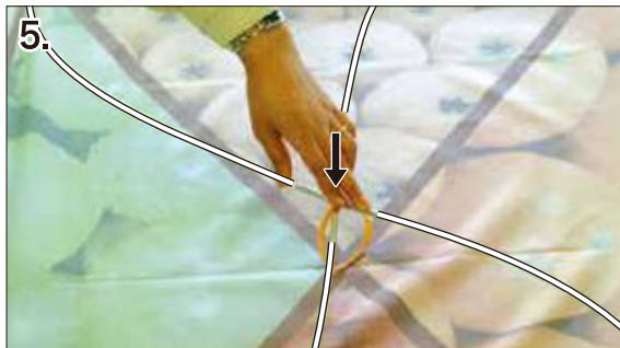
5. 交差部分の可動クロスをねじりながらパナー側に 押し下げます