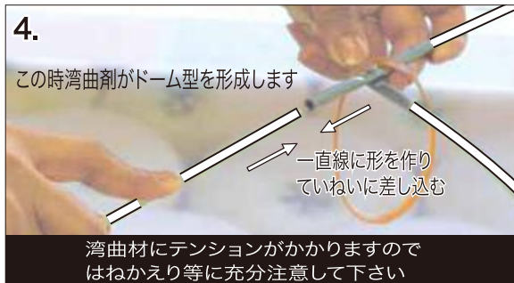
4. この時湾曲剤がドーム型を形成します 一直線に形を作り ていねいに差し込む 湾曲材にテンションがかかりますので はねかえり等に充分注意して下さい