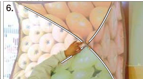
6. 湾曲材がパナーに添い パナーが「広げたときの傘」のよう なドーム型を形成します