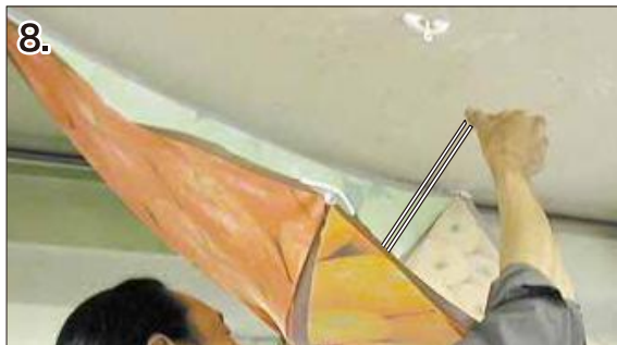
8. 内側の引っ掛け具を伸ばしながら設置場所に引っ かけます