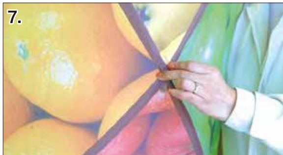
7. 外側からは中央の可動クロス部分と 内側からは引っ 掛け具を持ち