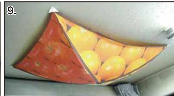
9. 位置と形を調整して取付けは完了です