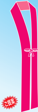
襟だけを抽出した タスキのような使い方

半天は販促効果の高いアイテムです。絵柄の改善点はデザイナーがアドバイスいたしますので、まずは形式にとらわれず、自由にデザインしてみてください。