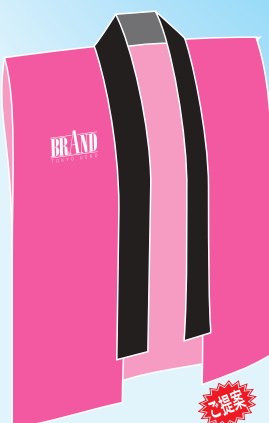
袖無し的身頃袷天